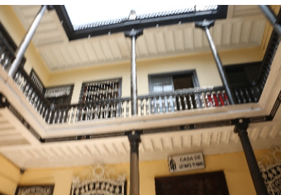
Casa(maison) de Saint Martin de Porres

Quand il mourut à l'âge de 60 ans, le 3 novembre 1639, ses funérailles furent célébrées devant un grand nombre des personnes qu'il avait aidées et aimées et avec qui, il avait prié. Le pape Grégoire XVI l'a déclaré bienheureux en 1837 et c'est le pape Jean XXIII, qui l'a déclaré saint à Rome le 6 mai 1962. Il est le patron de la justice sociale. Nous le nommons « Martin de la charité. »