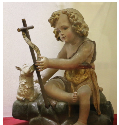
Lieu où sainte Rose soignait des malades. En haut à droite, la statue du petit docteur, Jésus